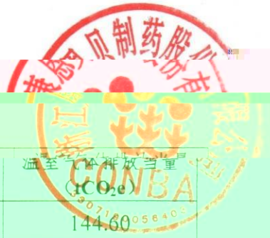
附表1. 报告主体温室气体排放总量